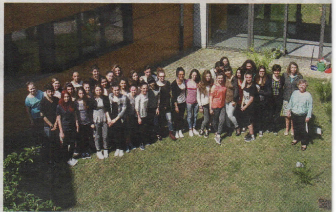
Nelle due foto, allieve e allievi che hanno partecipato al progetto